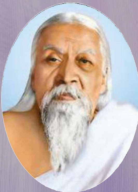
SRI AUROBINDO GHOSH (1872 - 1950)

SRI AUROBINDO COLLEGE (University of Delhi)